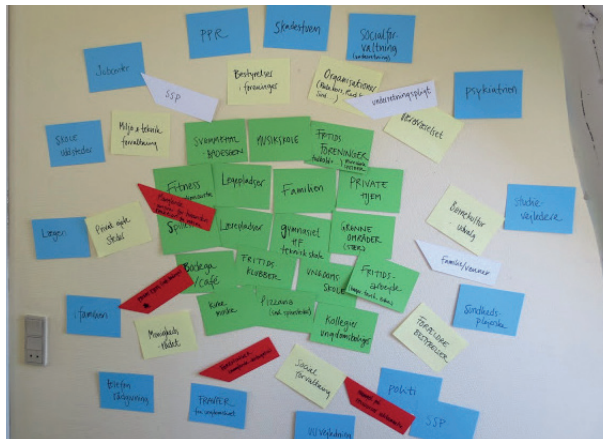
Figur 2 og 3.