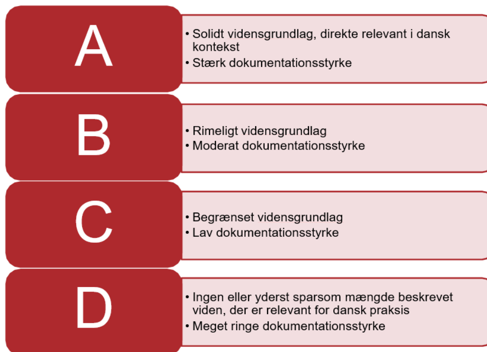
Figur 2: Karakteristik af de fire vidensniveauer

Vurderingen vises i et 'spindelvæv' med scoringen på de 5 dimensioner. Ud over vurderingen i spindelvævet gives et kort resumé af vidensindholdet under hver dimension. Et eksempel på en vidensdeklaration fremgår af bilag 2.