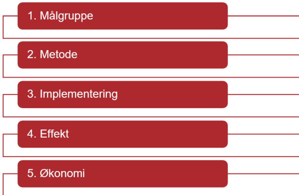
Figur 1: Videnstyperne i Vidensdeklarationen

til kravet om at gøre omhyggeligt, udtrykkeligt og kritisk brug af den aktuelt bedste viden, når der træffes beslutninger om andre menneskers velfærd.