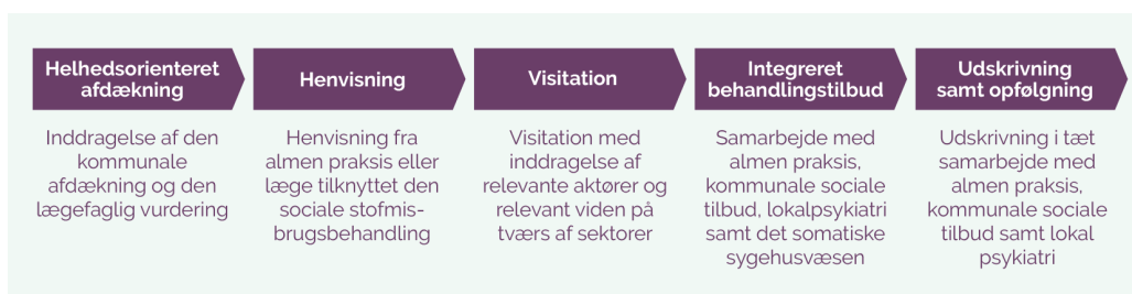
Figur 1: Samarbejde og koordination i forløbet

Nedenstående figur illustrerer samarbejdsfladerne på tværs af sektorer undervejs i forløbet fra henvisning til visitation og koordinering før, under og efter det integrerede forløb.