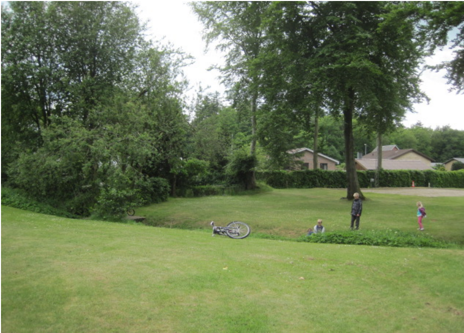
Naboernes huse ses her i baggrunden af området, hvor den nye bålhytte etableres