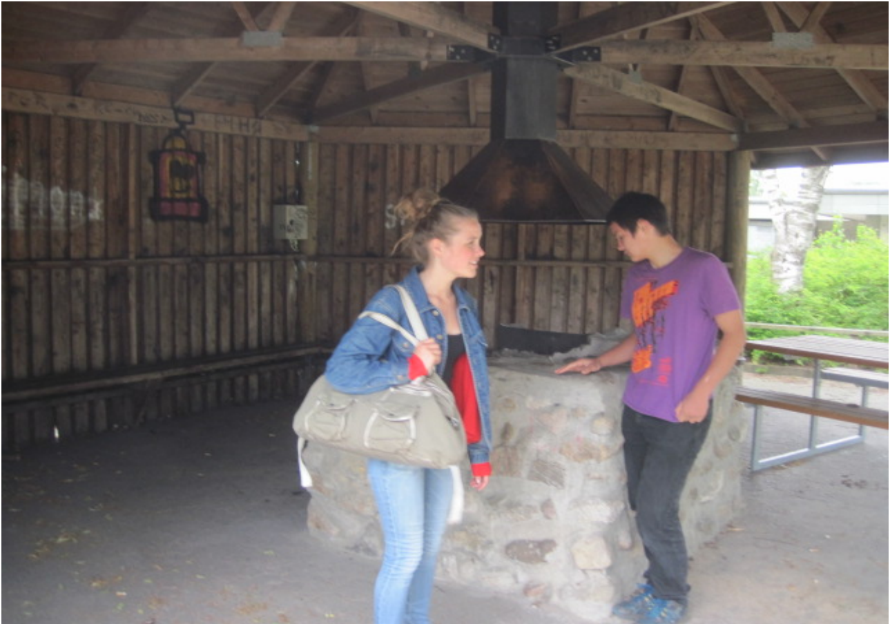
Unge i Thyregod får bl.a. en ny bålhytte til erstatning for denne som mødested.