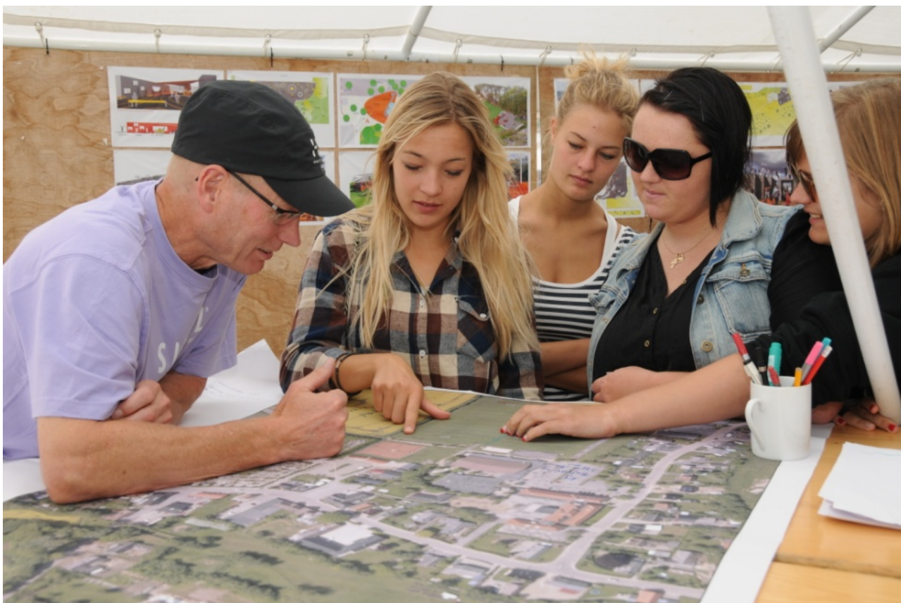
Unge kommer med forslag på standen ved byfesten i Smidstrup

Bl.a. på grund af tilgangen fra de øvrige voksne i de to processer, udspiller processerne sig lidt forskelligt i Smidstrup og Thyregod. I Smidstrup afkobles børn og unge, efter at de har leveret deres ideer og ønsker, mens enkelte unge i Thyregod kommer med i projektgruppen, der skal realisere projektet og dermed i de endelige beslutningsprocesser. Her er det dog vigtigt for de unge, at projektlederen hjælper med til at inddrage dem i diskussioner og få deres meninger frem, da de har svært ved selv at tage ordet.