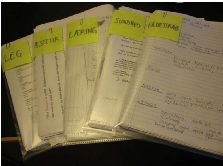
Bunken af papirer med forslag fra temadagen på skolen i Smidstrup.

alle kan komme med ideer. Men derefter har de ikke noget videre behov for at møde og inddrage børn og unge. Temadagen på skolen overlades til projektlederen og kommer derfor til at være afkoblet fra processen i projektgruppen, hvor kun lister med mange ideer kommer videre - altså ingen information om, hvor mange der synes de enkelte ideer er gode, hvad baggrunden for forslagene er, hvorfor børnene synes forslagene er relevante eller hvor meget engagement og energi, de enkelte ønsker kan mobilisere blandt de unge. I Smidstrup deltager de unge ikke efterfølgende i processen, som det skete i Thyregod.