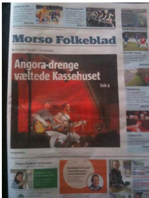
Forside i Morsø Folkeblad efter et GUF-arrangement

De unge mener dog, at de kunne lave endnu bedre arrangementer, hvis ikke de skulle bruge tiden på at skrive ansøgninger til kommunen og kæmpe med økonomien.