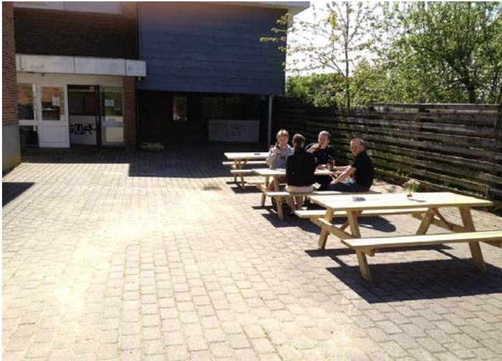
Nogle af de aktive unge fra GUR i Glyngøre foran indgang til deres værested

I Glyngøre afspejler projektlederens tilgang i høj grad et syn på de unge som medborgere. Der er stort fokus på de unges rettigheder til at blive betragtet som en vigtig interessegruppe i byen på linje med andre voksne interessegrupper. Samtidig er det projektlederens ide at uddanne de unge til at deltage i demokratiet og på den måde lære dem, hvordan de kan påvirke deres omgivelser. Projektlederen bruger meget tid på at indføre de unge i, hvordan de kan undersøge flere forskellige muligheder for at få et værested. De lærer at læse lovtekster, de lærer om hvordan kommunen og demokratiet er opbygget, de lærer at kommunikere med offentlige instanser osv.