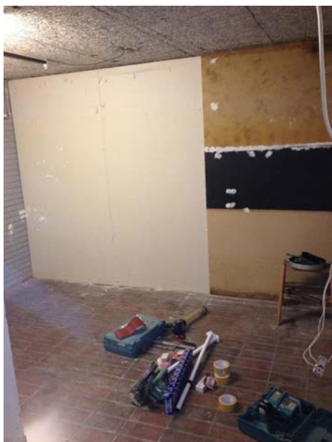
De unge har været i gang med at renovere det gamle diskotek, så det passer til deres behov.

De unge indgår i en forhandling om at få en fremadrettet lejeaftale på plads med hallen. Ifølge projektlederen har nogle af de voksne omkring halbestyrelsen i starten et unødigt skarpt fokus på evt. negative aspekter ved at have et tilholdssted for de unge. Op til GUR's opstartsarrangement og -fest (se nedenfor), havde halbestyreren været ned og inspicere lokalerne og klager herefter til projektlederen over, at der er opsat kasseapparat, hvilket tyder på alkoholsalg, som han ikke tror er lovligt. Dette er dog en unødigt bekymring, da GUR allerede har søgt om alkoholbevilling og har ansat professionelle dørmænd i tilfælde af, at nogen ikke opfører sig i henhold til reglerne. Efter et vellykket opstartsmøde (se nedenfor) holder GUR møde med halbestyrelsen d. 11. maj 2011 for at afstemme forventninger og det nærmere indhold i den lejekontrakt, som kort efter indgås. Ifølge de unge, har halbestyrelsen dårlige erfaringer med den tidligere lejer, og "de vidste jo ikke helt, hvad vi ville, og efter at de har fundet ud af det, er de glade for, at vi er hernede", som en af de unge siger bagefter.