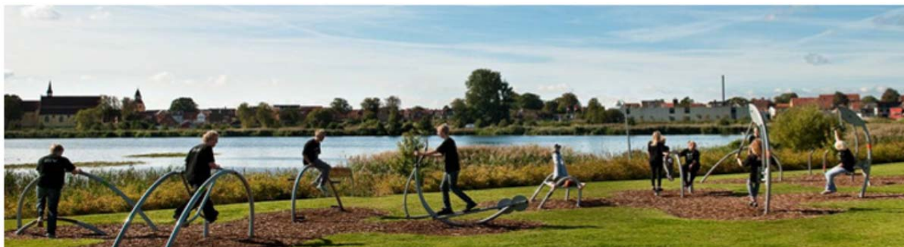
Forslag til udendørs fitness område med udsigt over søen

Dette projekt illustrerer en stærk lokal gruppe af voksne, der selv tager ansvar for processen, og hvor projektlederen mest sidder på sidelinjen og står for inddragelsen af børn og unge. Børn og unges inddragelse sker på byfesten og på skolens temadag (se bilag 2 for en uddybning af formål og metoder i projektet). Børne- og ungeinddragelsen foregår stort set adskilt fra projektgruppens arbejde, og børn og unge kommer med en masse forslag, der ikke-prioriteret overleveres til projektgruppen i form af lange lister med mulige aktiviteter. Projektgruppen med de voksne prioriterer og vælger de aktiviteter, der skal realiseres og står også for realiseringen.