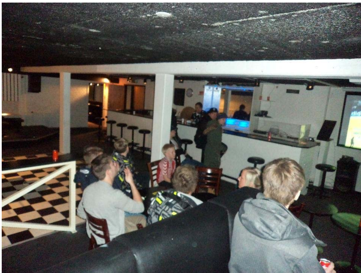
Der afholdes håndbollsarrangement for børn og unge i GUR i forbindelse med EM i herrehåndbold

Desuden afholdes der arrangementer i forbindelse med sportsbegivenheder, som vises på storskærm, og så kan alle – børn, unge og voksne – komme og se kampen sammen. En fra bestyrelsen siger: