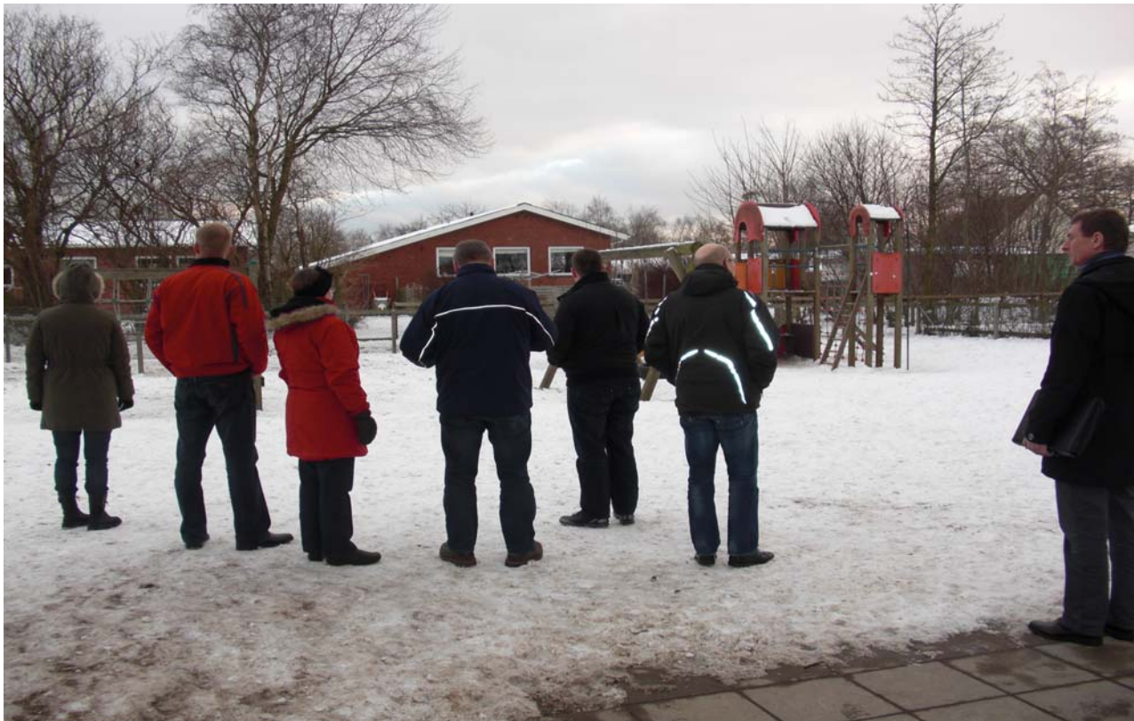
Voksne fra lokalråd på besigtigelse af område til aktiviteter.

gang med at inddrage børn og unge. De er godt kendte med deres vilkår, og især i Glyngøre ser de unge det som en meget stor fordel, at konsulenten har så mange kontakter i lokalområdet, at han kan skaffe viden og ressourcer til projektet.