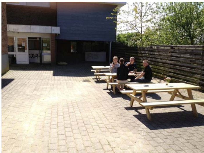
De unge finder, at det forhenværende diskotek Downstairs, som ligger i samme bygning som hallen, vil være velegnet som deres sted. Her ses indgangen og nogle af de unge.

De unge har altså som en start dannet et Glyngøre Ungdomsråd (GUR), hvor en lille gruppe unge i alderen 14-25 er drivkræfter for at få et værested som er deres eget.