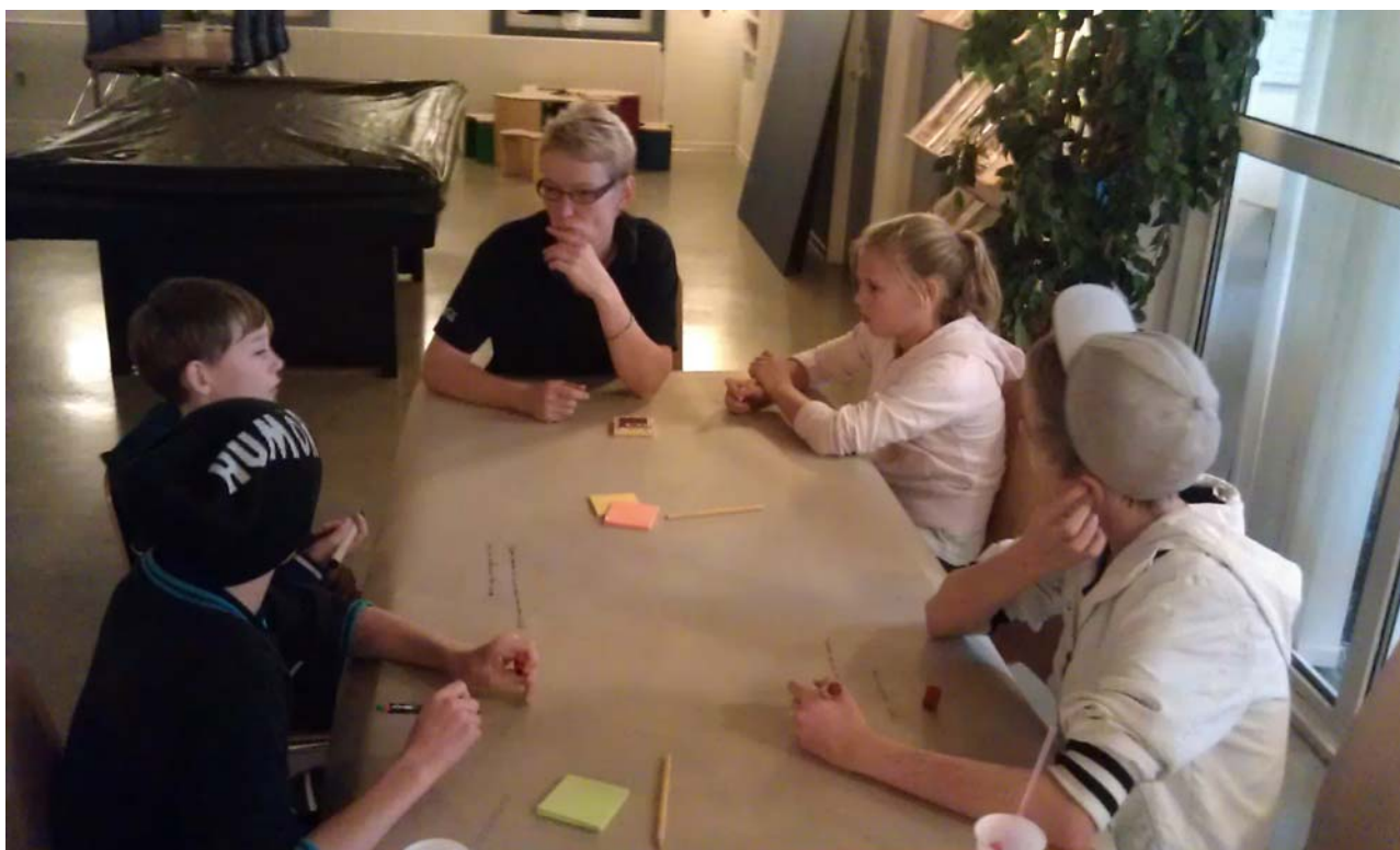
Fra Drømmedagen i Thyregod. Alder ca. 12 år.

I Thyregod mødte meget få op til den drømmedag, der var tænkt og planlagt som noget meget større, og det var især en yngre gruppe børn, der kom, og ikke mange unge. Ved et efterfølgende kort møde i ungdomsklubben, for at få flere i tale, synes de unge det var ok med en halv time, hvor de kunne stille en masse forslag. Der blev dog ikke fulgt op med en fælles udvikling af forslag eller prioritering af forslag. De tre unge, der senere indgår i projektgruppen mener da heller ikke, at de har været med til at beslutte, hvad der skulle laves. Men de er alligevel glade for at være med i projektgruppen og også glade for projektet – især for bålhuset, som mest afspejler deres interesse i et værested for unge. I hverken Smidstrup eller Thyregod fik de unge for alvor lov til at være med til at prioritere de ideer, der kom på banen.