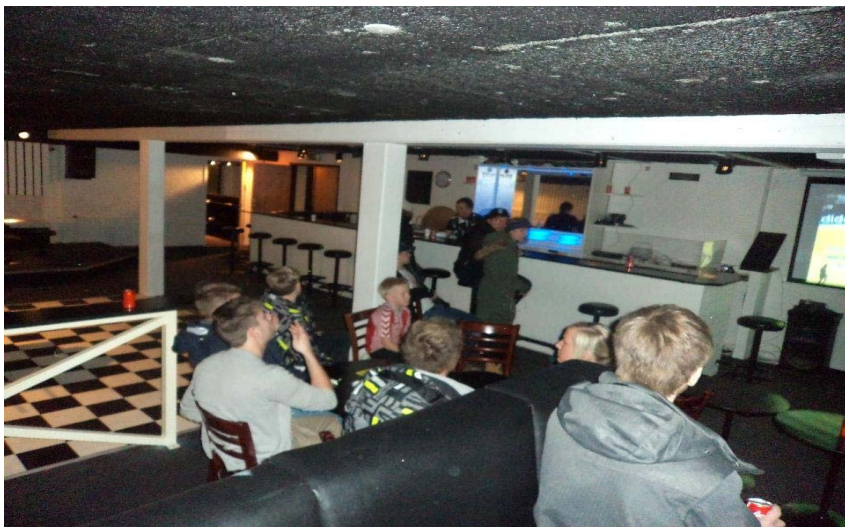
Der ses EM i håndbold på storskærm i GUR's lokaler i Glyngøre

Dette projekt adskiller sig fra de andre projekter ved, at vi har at gøre med en meget aktiv gruppe unge, der i forvejen har defineret, hvad de vil og kæmper for at få det opfyldt gennem projektdeltagelsen med stor støtte fra projektlederen og lokalsamfundet. De unge er ældre end i de andre projekter – mange af dem