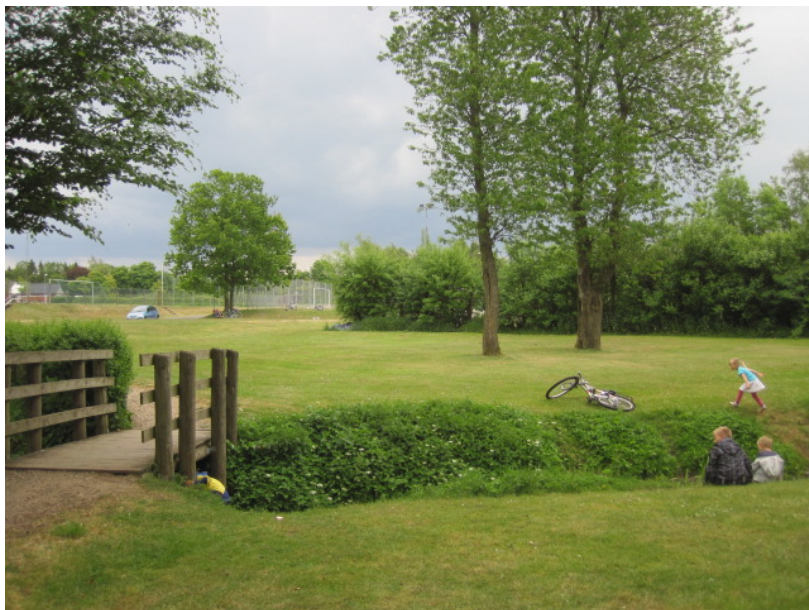
Del af det område, der kan bruges til Lille Bane-projektet

Man bliver hurtigt enige om, at man kan lave en form for "Lille Bane"-projekt udendørs på et område, som hallen ejer og gerne vil stille til rådighed, hvor man kan arbejde på at få udviklet en række aktiviteter som børn og unge har efterspurgt. Desuden vil man gerne arbejde videre med udvidelsen af klubben, som de unge ønskede. Der bliver nedsat projektgruppe til begge projekter, der skal komme med forslag til næste møde.