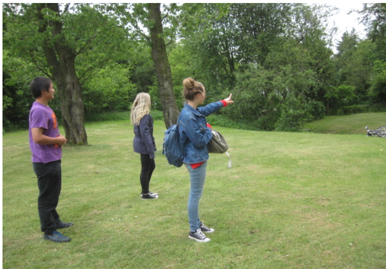
Unge fra projektgruppen i Thyregod viser rundt på området, hvor der skal skabes aktiviteter.

Børn og unge har ikke de samme erfaringer, samme magt eller den samme viden at trække på som de voksne, og de vil ikke kunne tale med samme vægt som de voksne i f.eks. en projektgruppe. De vil nemt kunne overbevises om, at deres ønsker er urealistiske, som vi ser i både Smidstrup og Thyregod. Muligvis var nogle af ønskerne også udenfor de økonomiske rammer, men derfor har børn og unge fra et medborgerperspektiv stadig ret til at blive hørt, og få taget deres ønsker og behov alvorligt. Så det handler både om at tilføre børnene ressourcer, bl.a. ved at sikre en respektfuld og tillidsfuld dialog, der styrker børn og unges selvværd, så de tør tale deres sag, og stille spørgsmål ved de voksnes argumenter. Men også om at uddanne de voksne til at kunne møde de unge i øjenhøjde og afgive den magt, der er nødvendigt herfor.