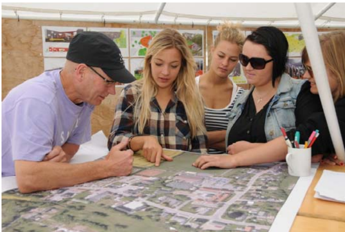
De unge kommer med ideer på Smidstrup byfest

Alle betragter timerne på standen som en succes, fordi så mange kom forbi og udviste stor interesse.