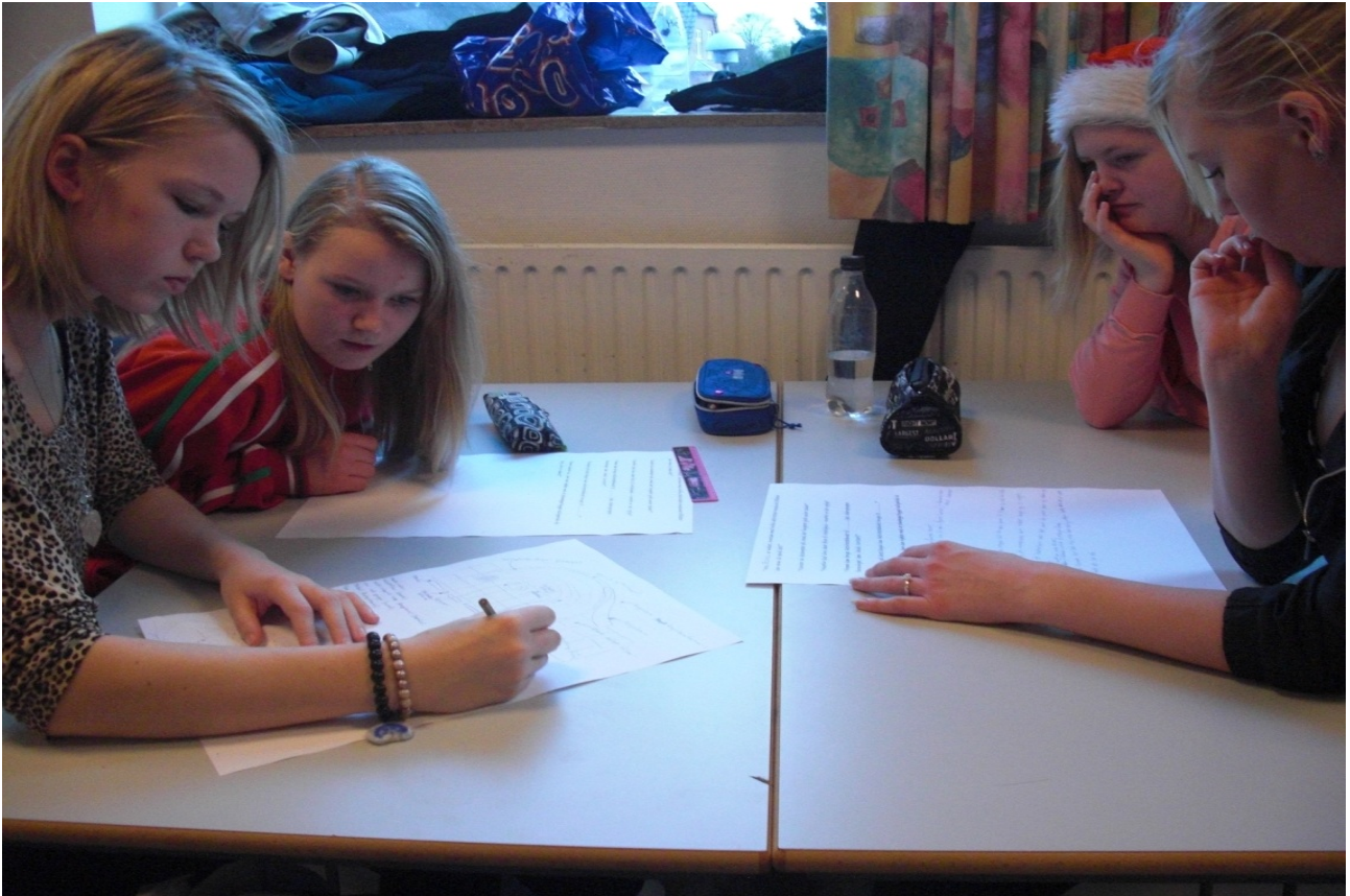
Temadag på Smidstrup Skole. De fem næsten ens poster bliver kedelige i længden

Efter temadagen samler projektleder alle papirerne fra dagen og laver en lang liste med forslag, der er sorteret i forhold til temaerne, men ikke prioriteret fra projektlederens side.