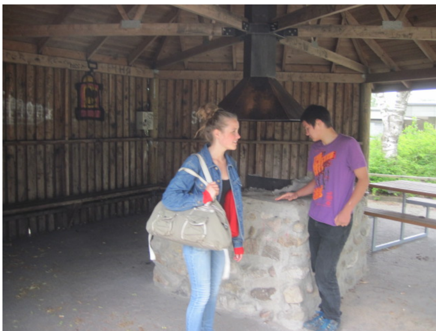
De unge i projektgruppen viser den gamle bålhytte frem

”Vi har ikke haft indflydelse på, hvad det blev til – nej, for de voksne valgte selv, hvad det skulle blive til, for vi kom ind bagefter. Men vi synes at det er ok, at det også skal bruges til andre, fx vi kan tage vores små søskende med på tarzanbanen, mens vi er ved bålhytten og andre børnehaver kan bruge det. Der er kun skolen som legeplads.”