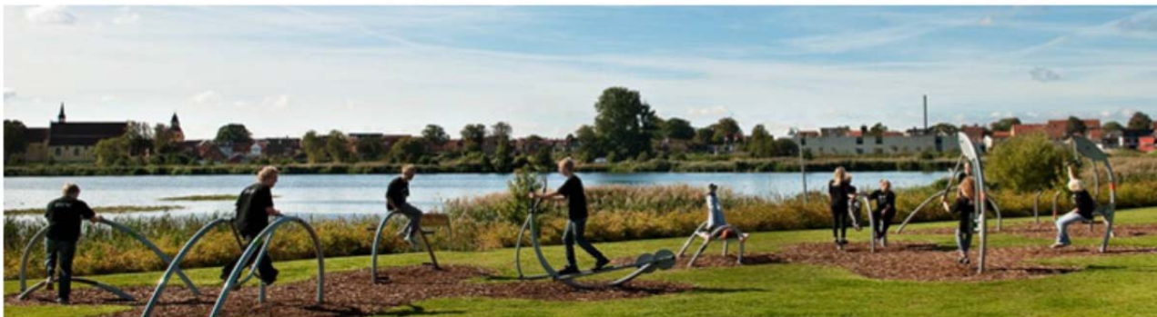
Udendørs fitnessområde med udsigt over søen

Materialet sendes til kommunen sammen med to ansøgninger om to konkrete projekter: fornyelse af multibane og etablering af udendørs fitness-område. Begge ansøgninger henviser til de unges deltagelse og indflydelse, men også til at projekterne skal være med til at trække tilflyttere til området, og at det skal kunne bruges af alle.