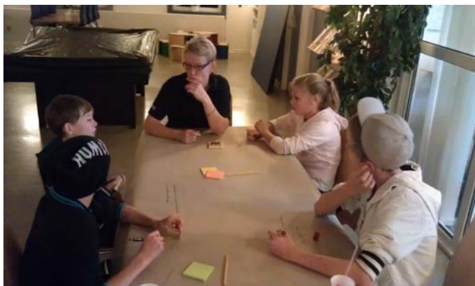
Drømmedag i Thyregod. De fremmødte var i gennemsnit ca. 12 år

Det var en svær start på dagen, men der var god energi og mange af børnene ville gerne være med i det videre forløb.