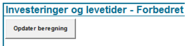
Figur 4. For at opdatere beregningsarket trykkes på knappen ”Opdater beregning”.

Når al data, inklusive dokumentation, er indtastet, og totaløkonomiberegningen er gennemført ( vigtigt: der trykkes på knappen ”Opdater beregning” ), opdateres resultatdelen øverst på første ark, og det fremgår tydeligt om det indtastede projekt overholder kravene til totaløkonomisk rentabilitet.